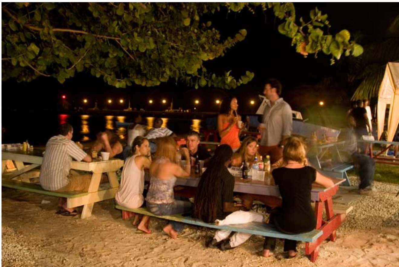
Acima, frequentadores comem e bebem em mesas de Oistins, ponto de encontro de turistas e locais às sextas-feiras. Ao lado, a entrada do lugar; e o hotel The Crane, na praia de mesmo nome