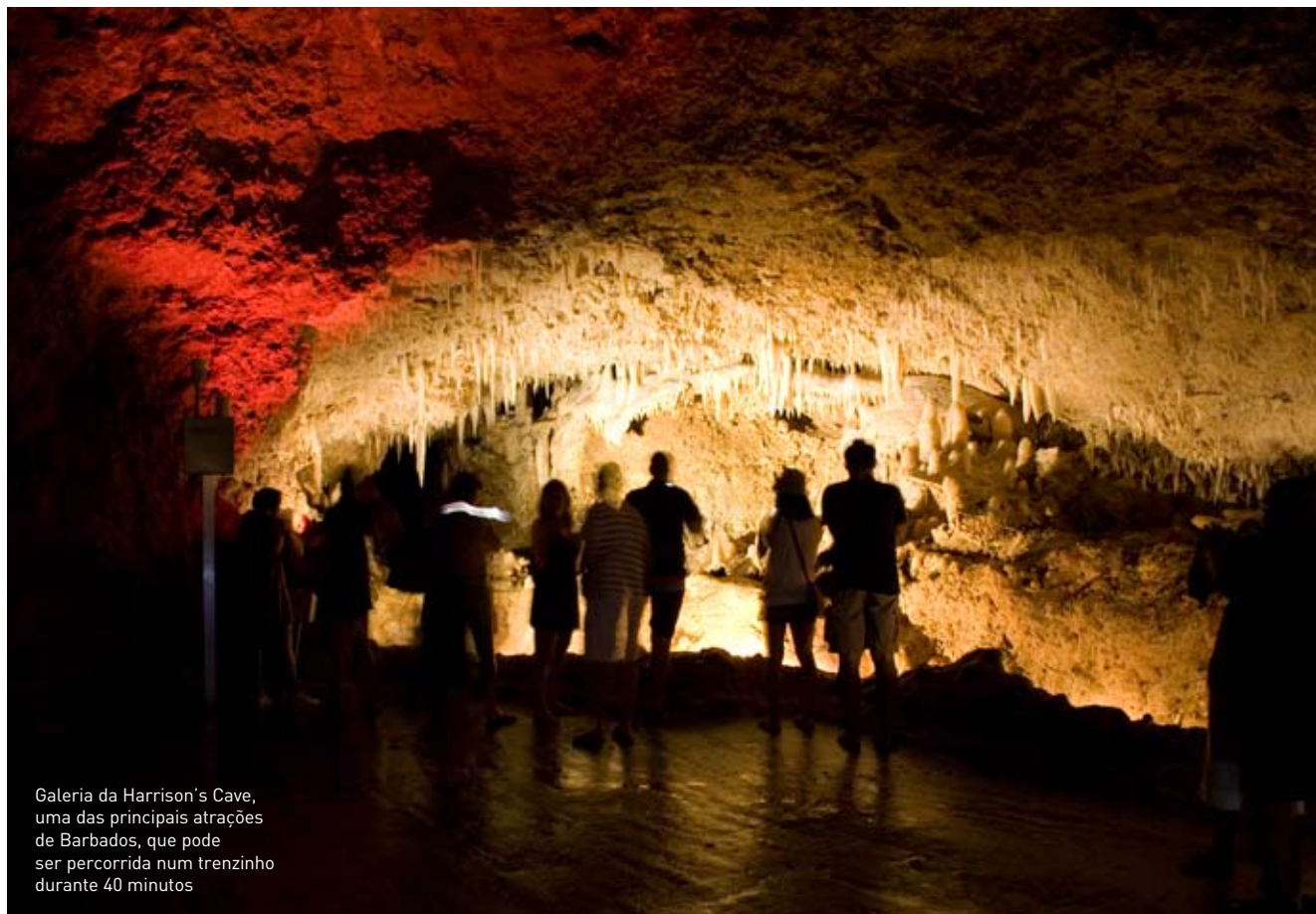
Galeria da Harrison's Cave, uma das principais atrações de Barbados, que pode ser percorrida num trenzinho durante 40 minutos