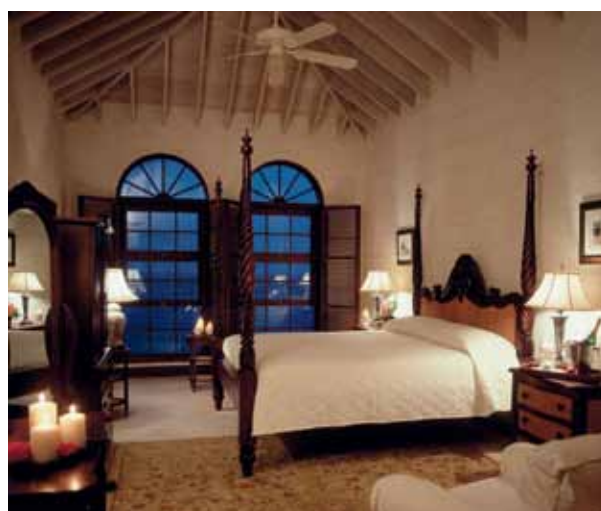
The Crane Hotel e interior de seus quartos